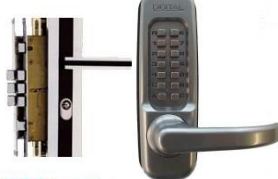
Doble Multicerradura Modelo Fortaleza